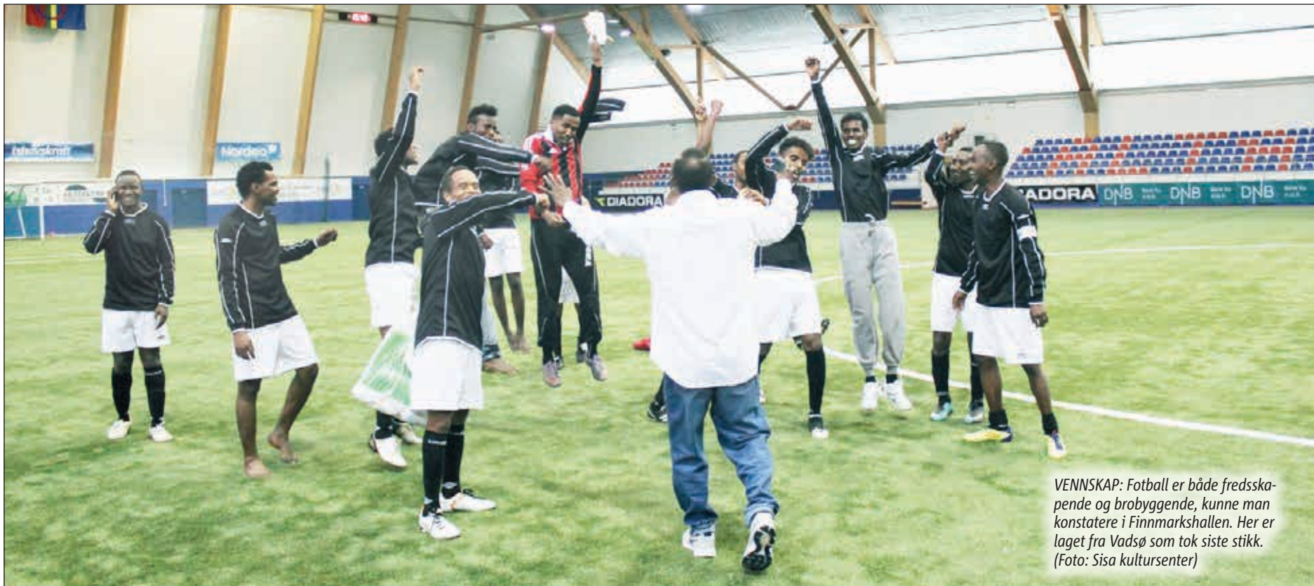
VENNSKAP: Fotball er både fredsskape og brobyggende, kunne man konstatere i Finnmarkshallen. Her er laget fra Vadsø som tok siste stikk.